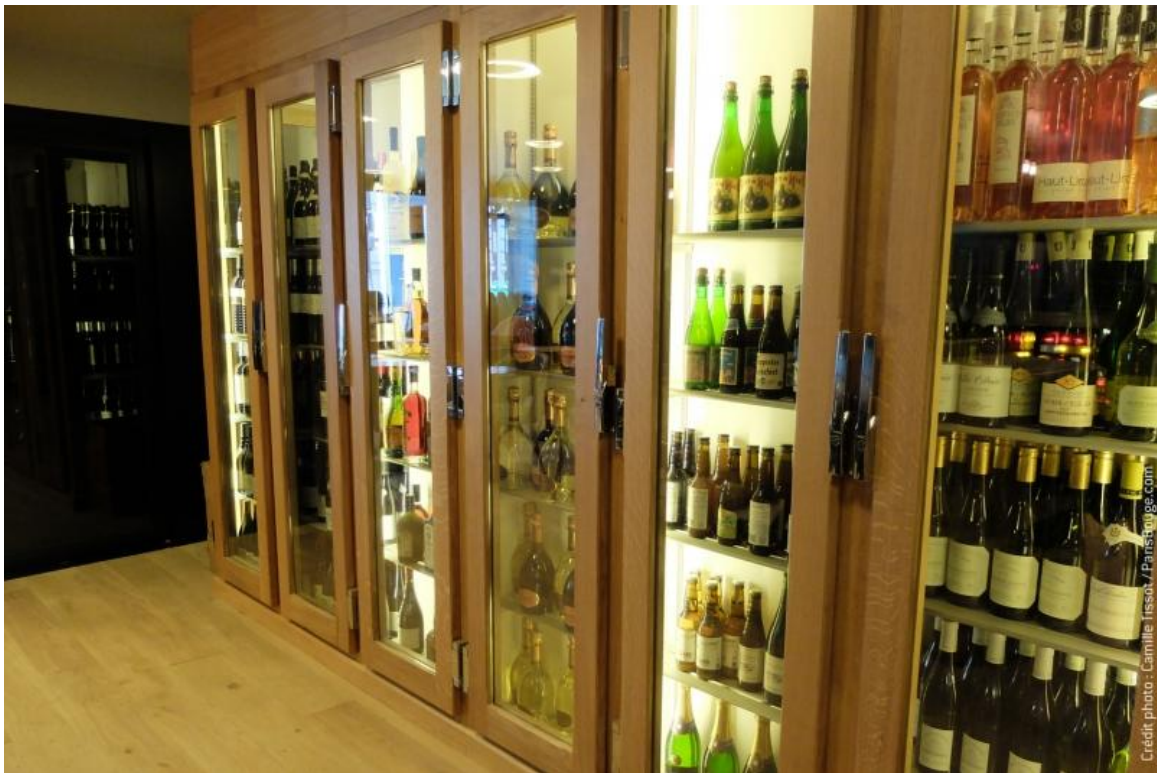
Restaurant « Les Petites Ecuries » - 40 rue des Petites Ecuries, 75010 Paris